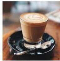
東太平洋有機咖啡組合包|海風拿鐵 $120

以Instagram #咖啡的201萬則社群貼文為消費人次計算基礎，透過LINE Chatbot進行東太平洋有機咖啡推廣，若每杯或每份精品咖啡僅120元計(201,000 x $120=$24,120,000)，整體產值可達到逾2億4千1百萬元的收入。